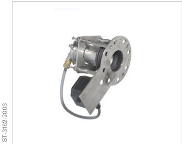
Dräger Pulsar 7000 Gắn ống dẫn