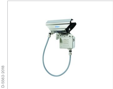
Dräger Pulsar 7000 Công suất lớn