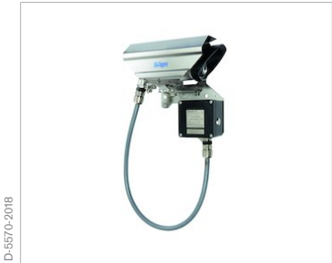
Dräger Pulsar 7000